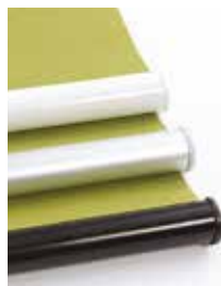
Rundad, vit, alu eller svart