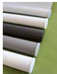
Oval, i 5 olika nyanser