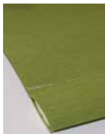
Fällkäpp, dold list i väven.