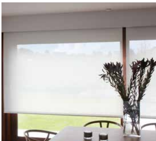
Utsikt genom en ljus screenväv

Det är några olika faktorer att ta hänsyn till beroende på behovet när man väljer screenväv och dessa är öppningsfaktorn, färgen och om väven ska vara metalliserad.