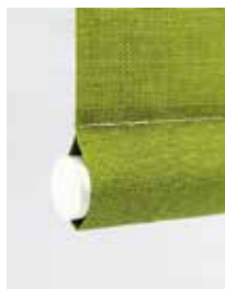
Rundad, dold list i väven.