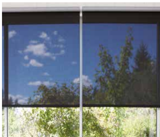
Utsikt genom en mörk screenväv