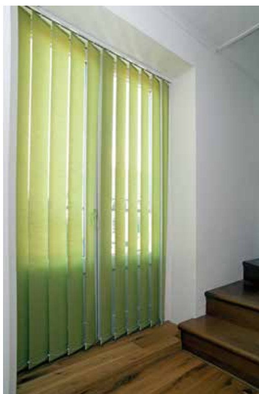
Lamellgardin i nisch