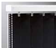
Lina och kulkedja