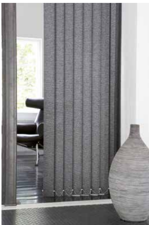
Lamellgardin i dörröppning

Trevira är av polyesterfiber och en kombiantion av fiber och garn som är behandlat före vävning. Dessa vävar är flamsäkra.